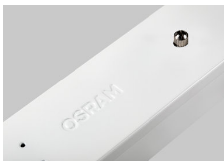
AirZing 5040 Product