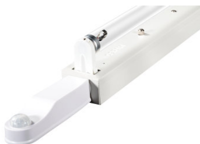
AirZing 5040 Product