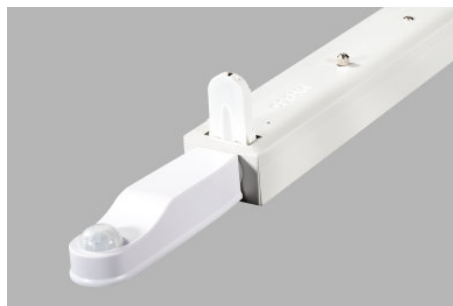
AirZing 5040 Product