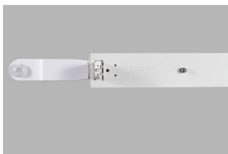
AirZing 5040 Product