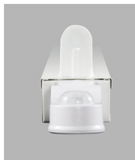
AirZing 5040 Product