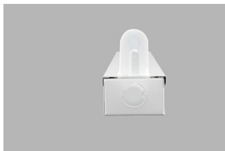
AirZing 5040 Product